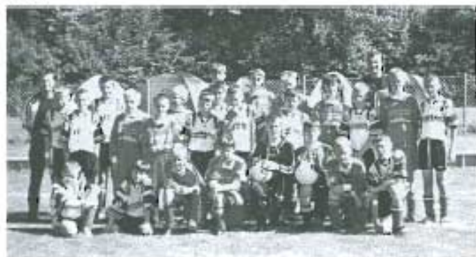
Kahla und der FCF vor dem Spiel