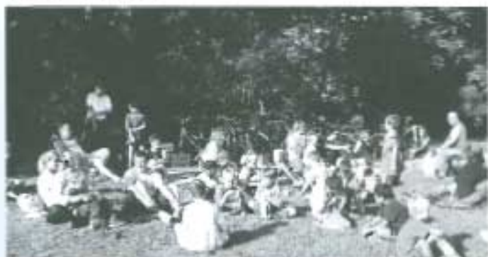
Feier am See