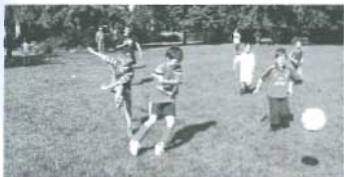
Mit Feuerzifer dabei