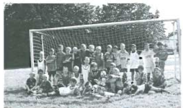
Abschlussturnier der F-Jugend.

Am letzten Trainingstag veranstalteten wir mit unserer F2 ein kleines internes Turnier, was glaube ich, allen Spaß gemacht hat. Von beiden Mannschaften, wurden die jeweils 4 vermeintlich besseren Spieler zu 4 Mannschaften gesetzt und die restlichen Kinder dazugelost. Somit entstanden 4 einigermaßen gleichwertige Mannschaften.