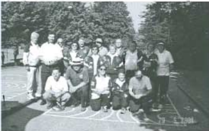
Zu Beginn alle Stockler noch frohen Mutes

19 Stockschützen trafen sich beim Sommerfest des FCF um ihre Vereinsmeister in Mannschaft und Einzeldisziplin zu ermitteln. Bei wiederum schönen Wetter und damit guten Bedingungen starteten wir mit dem Mannschaftsturnier mit Vor- und Rückrunde.