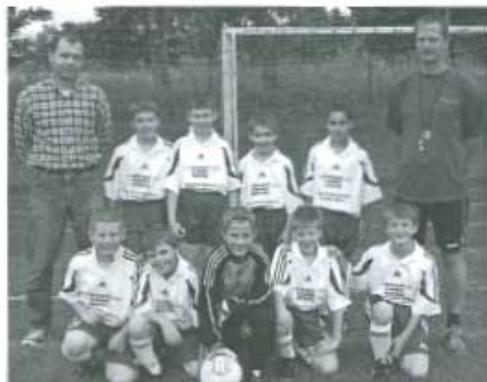
Unsere E3-Jugend mit den beiden Trainern.